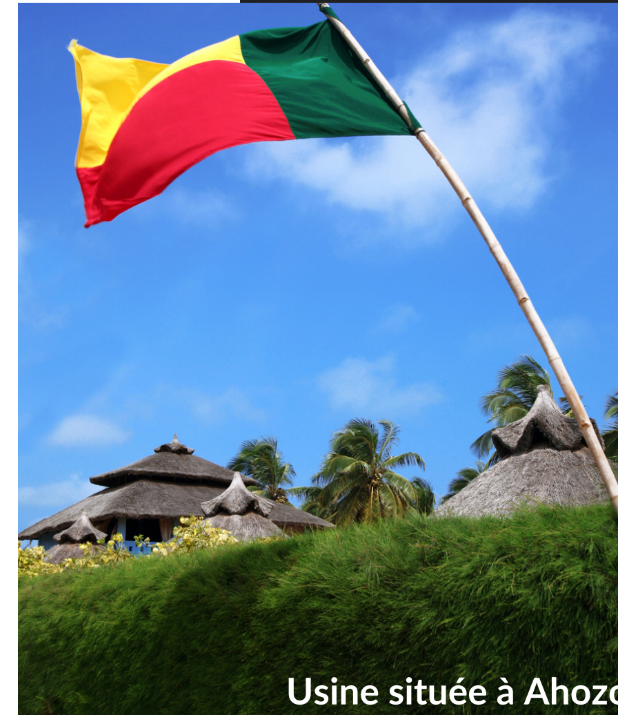
Usine située à Ahozon, dans la commune de Ouidah.

Au cœur de cette alliance se trouve la Fondation VALDEO, créée dans le but de soutenir et de promouvoir les initiatives en faveur de l'environnement, de l'éducation et du développement social au Bénin. La Fondation agit comme un catalyseur de changement, en collaborant avec des organisations locales et en apportant un soutien financier et technique à des projets qui font une réelle différence dans la vie des communautés.